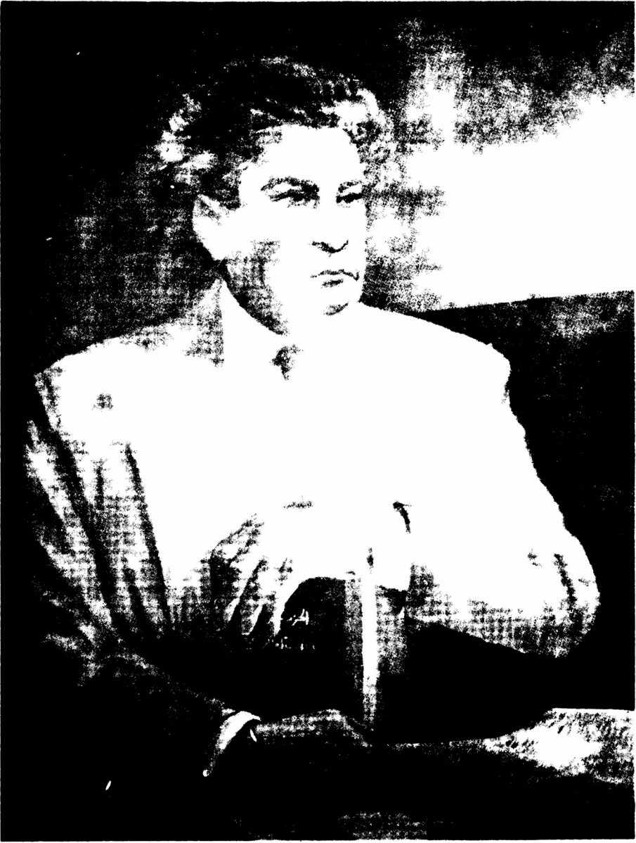
بريشة الفنان : فيصل لعبيي